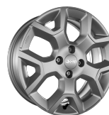
Cerchi in lega da 17"